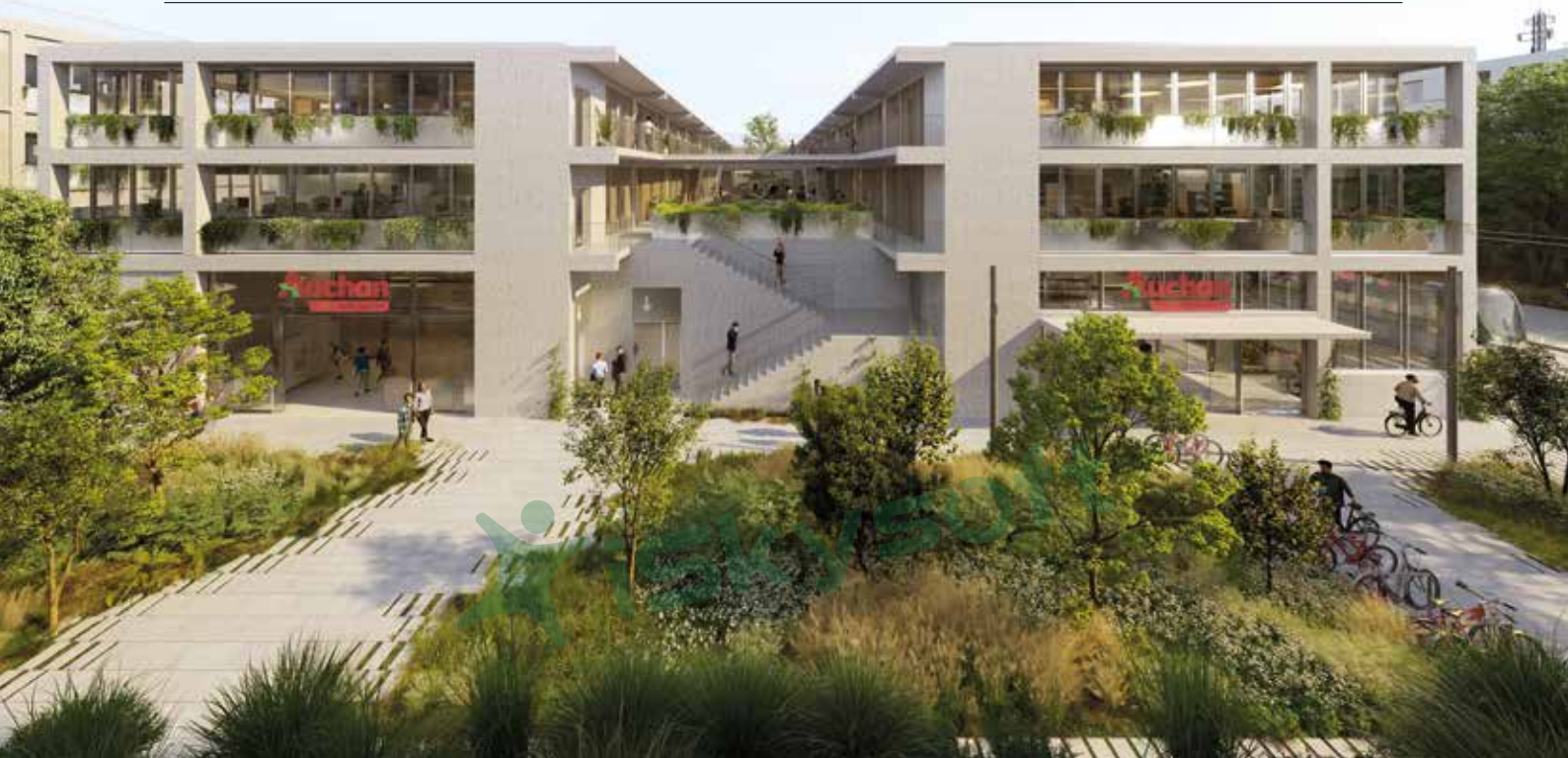
> Perspective du futur magasin Auchan, des bureaux et de l'esplanade

Lancés en octobre dernier, les travaux de requalification de l'îlot Auchan Cournord se poursuivent. Cap vers un cœur de quartier à la fois vivant et apaisé.