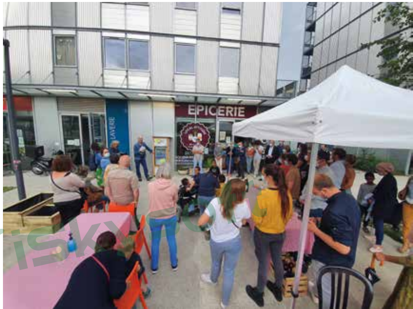
> Inauguration du frigo zéro gaspi, fourni par le CREPAQ, devant l'épicerie de Local'Attitude

Créée par des habitants du quartier du Grand Parc, l'association Local'Attitude a ouvert en 2019 une épicerie solidaire destinée à promouvoir une alimentation saine, tout en favorisant mixité et lien social. Elle se lance aujourd'hui dans la création d'un jardin potager.